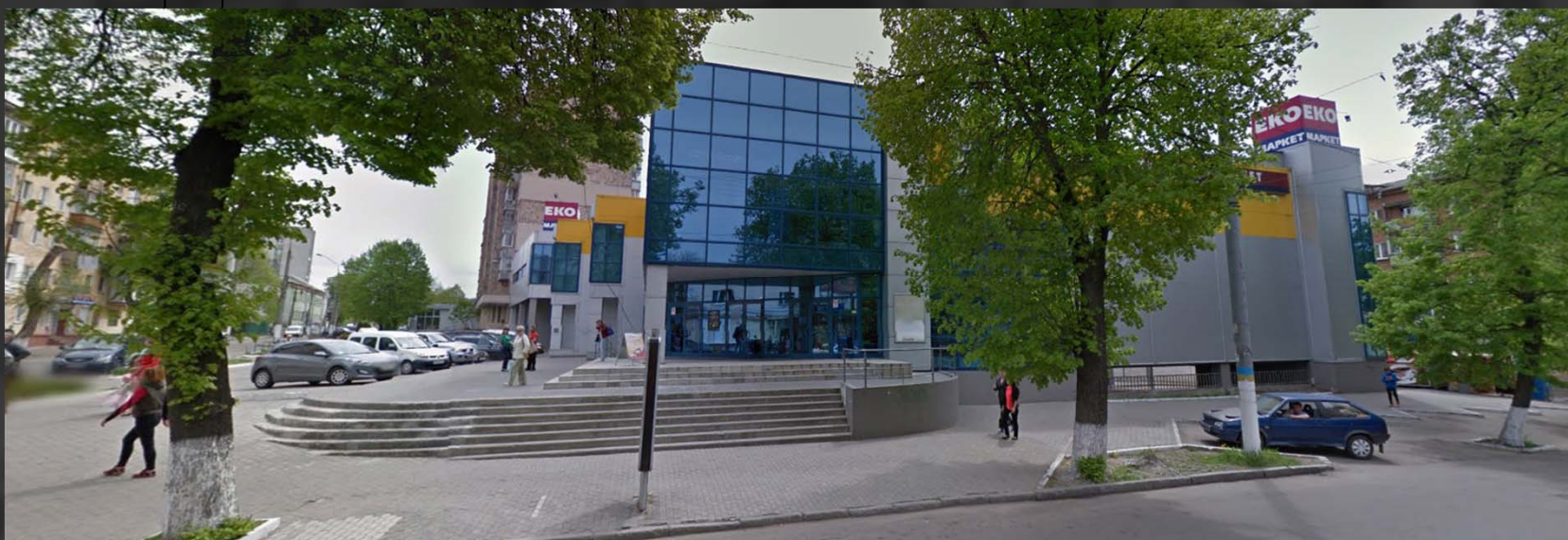
Фасад с улицы Черняховского