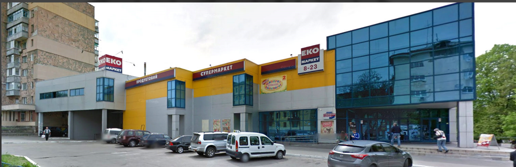
Фасад с улицы Малая Бердичевская